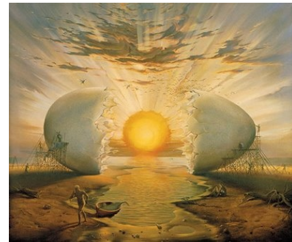
Sunrise by the Ocean