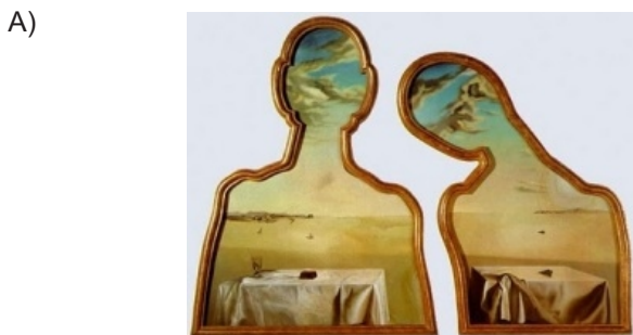
A Couple with Their Heads Full of Clouds, 1936.

A imagem que reproduz o quadro de Salvador Dali citado no texto é: