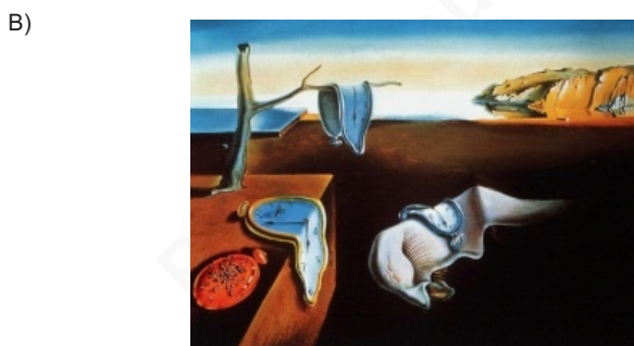
A Persistência da Memória