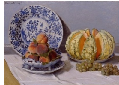
Natureza Morta com Melões