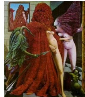
The robing of the bride – 1940